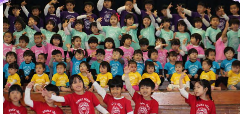
保護者の皆さんの励ましとご協力、ありがとうございました。