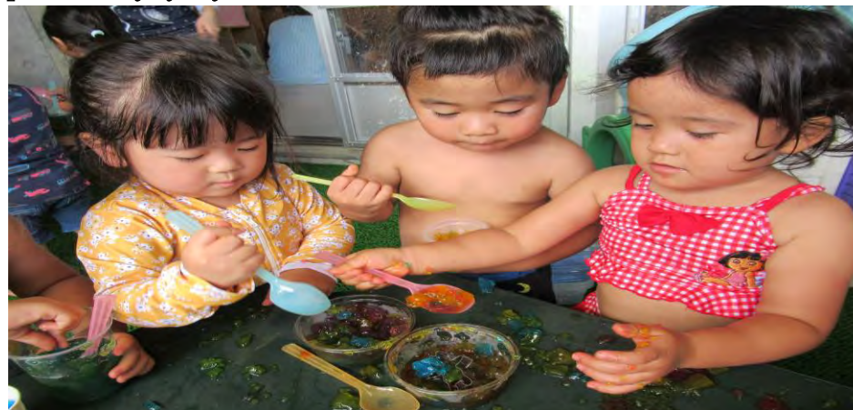
寒天ゼリー♪ 気持ちいいな♪