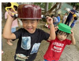
雨の日でも楽しむくま組さん