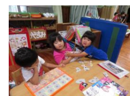
まったくもう・・・