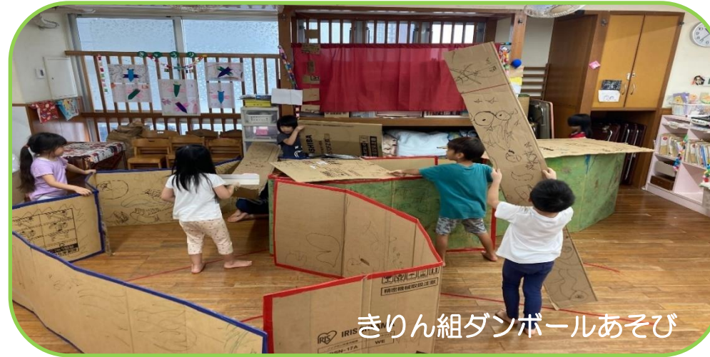
きりん組ダンボールあそび

社会福祉法人 郵住協福祉会 ガジマル保育園 那覇市銘苅1-18-19 Tel: 866-1174 Fax: 868-9355